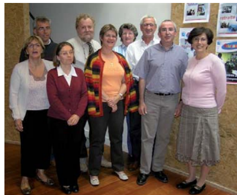
La commission fédérale SPELCL du second degré