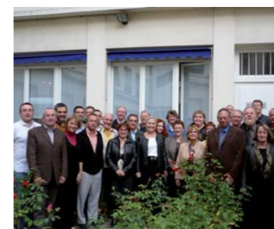
Les délégués SPELC aux commissions académiques de l'emploi, réunis à Paris, au mois d'octobre dernier