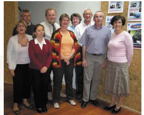
La commission fédérale SPELCL du second degré

JE VEUX DES INFORMATIONS OBJECTIVES SANS CONSIDERATIONS POLITIQUES